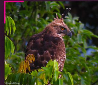
▲ Lang gunung Mountain hawk-eagle Nisaetus nipalensis