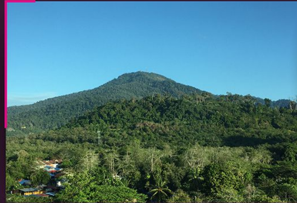
▲ Gunung Raya, pandangan dari Selat Tuba Gunung Raya view from the Straits of Tuba

Gunung Raya is rich in biological diversity, particularly amphibians and reptilians. Among the interesting species here are two new species, Gunung Raya green-crested lizard ( Bronchocela rayaensis ) and Mahsuri's rock gecko ( Cnemaspis mahsuriae ). There is also the Short-hand forest gecko ( Cyrtodactylus brevipalmatus ), which is a new Malaysian record (previously endemic to Thailand). The mountain also supports the biggest population of Great hornbill ( Buceros bicornis ), which is the largest hornbill in Malaysia. Gunung Raya is linked to the mythical fight between two giants, Mat Raya and Mat Chinchang who were both cursed by Sang Gedembai into mountains. Gunung Raya has not been fully developed for geotourism activities and efforts are being made to propose this area as the fourth geopark in Langkawi.