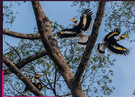
▲ Enggang papan Great hornbill Buceros bicornis