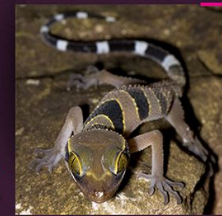
Cicak bertukil kasar Tuberculated gecko Cyrtodactylus macrotuberculatus