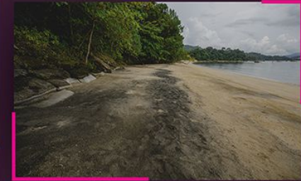
▲ Pantai Pasir Hitam Pasir Hitam beach