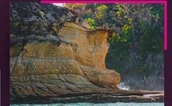
Takik laut kuno Ancient sea notch