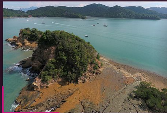
Pentas hakisan ombak kuno meluas antara dua bukit baki Ancient wave abrasion platform in between two remnant hills