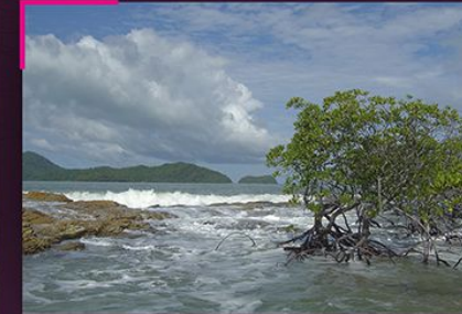
Bakau pasir Rhizophora stylosa yang tumbuh di atas pentas hakisan Red mangrove Rhizophora stylosa growing on abrasional platform