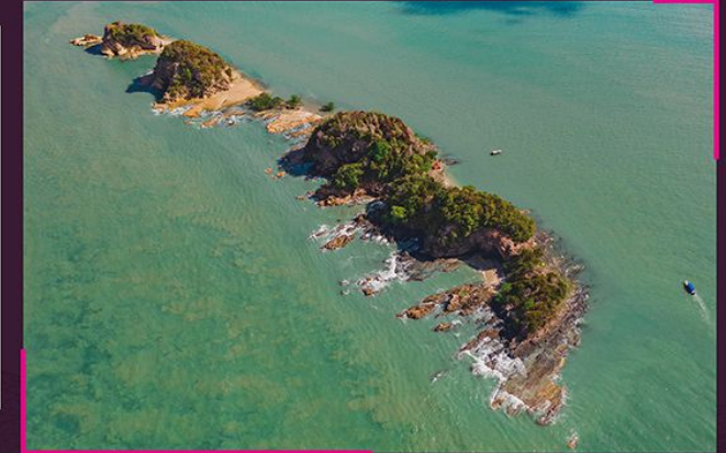
Pandangan Pulau Ular dari udara Aerial view of Pulau Ular