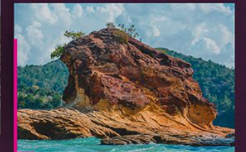
Tunggul laut di atas pentas hakisan kuno Sea stack on ancient abrasional platform