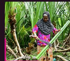
▼ Pokok pandan Pandanus Amaryllifolius