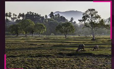
▲ Kampung, sawah padi dan kerbau Village, paddy field and buffalo